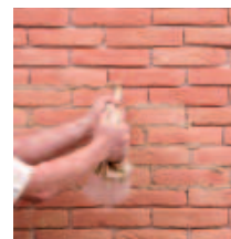
2 ... STUCCO