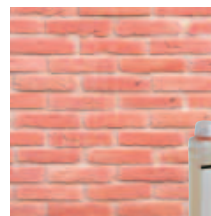
4 ... per uso all'esterno, sottopongo il rivestimento a un trattamento idrorepellente