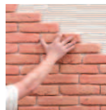
1 ... POSO