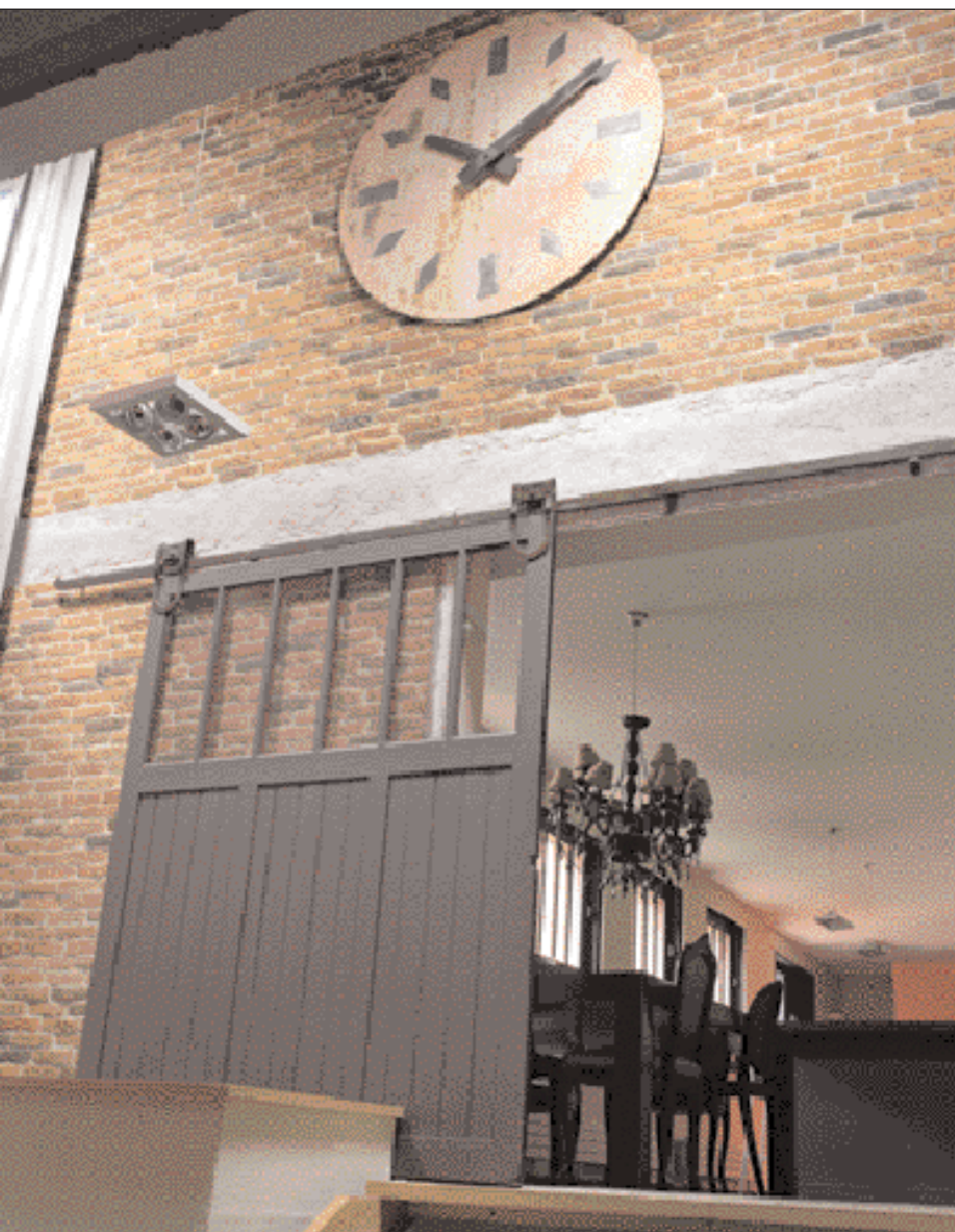
Spirito loft brique 5 tons