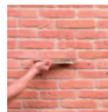
3 ... SPAZZOLO